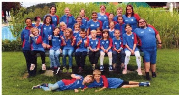
Verein SRT Limpachtal

Die Schweizerische Lebensrettungsgesellschaft SLRG ist eine Wasserretter-